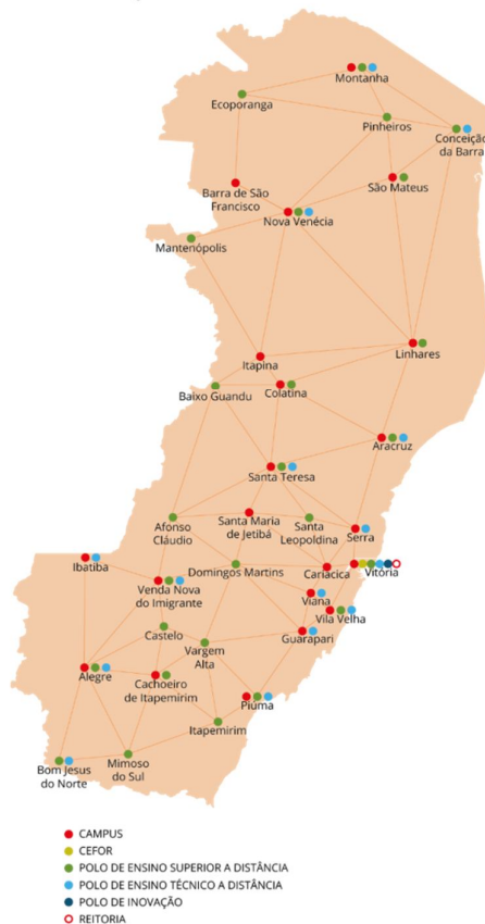
Figura 1 – Localização do município de Piúma e o Ifes-Campus Piúma no contexto estadual

A pesca é, no município de Piúma, uma das principais atividades econômicas, assim reconhecida entre as décadas de 1970 a 1990 (MARCHIORI et al., 2014). O município ocupa, atualmente, a posição de quarto maior produtor de pescado do Espírito Santo (MPA, 2013).